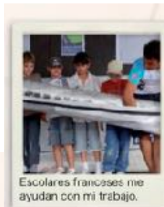
Escolares franceses me ayudan con mi trabajo.