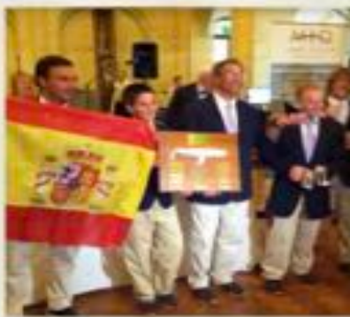
CAMPEÓN DEL MUNDO