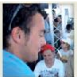
Intercambiando impresiones con niñas con el s. de Down.

2012: La vuelta al mundo de Hugo es seguida por miles de escolares.