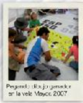
Pegando dibujo ganador en la vela Mayo 2007.