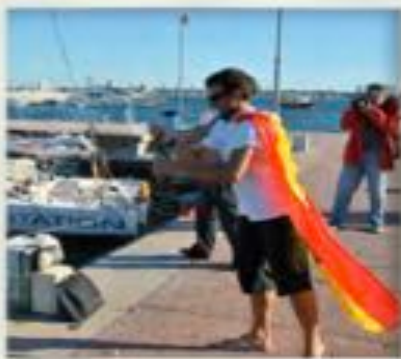
VUELTA AL MUNDO

En mi vuelta al circuito Mini 650, me he alzado con la victoria en las 500 Millas en solitario “Massilia Cup” y he podido imponerme en el circuito Mediterráneo 2023.