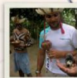
Intercambio de impresiones con Indios Txariri-Kokó.